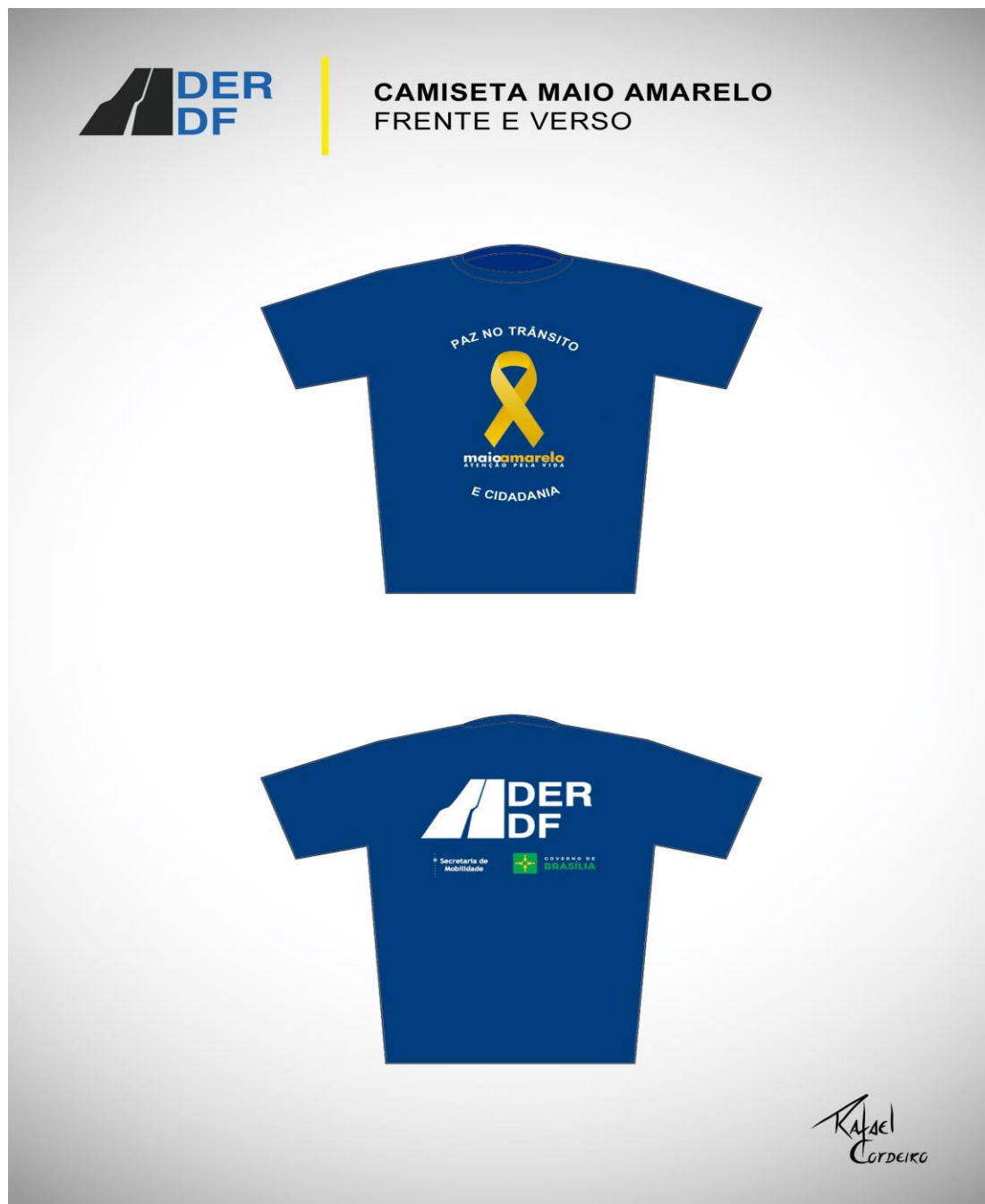
IMAGEM 1 – CAMISETA