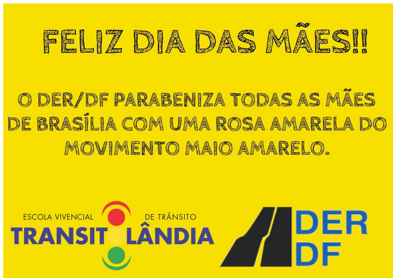
- Rosa e cartão