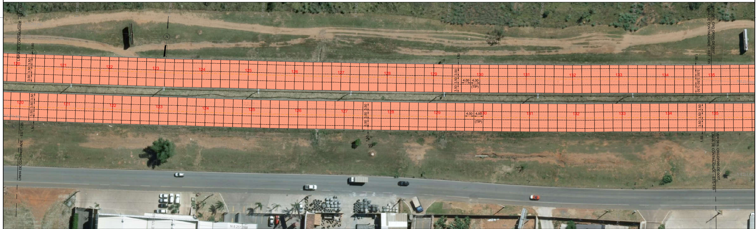
PLANTA 0 4 8 16 32m ESCALA 1:400

NOTAS: 1 - TODAS AS DIMENSÕES ESTÃO EM METRO, EXCETO ONDE INDICADO. 2 - PARA DETALHES DE GEOMETRIA, TERRAPLENAGEM, DRENAGEM E SINALIZAÇÃO, CONSULTAR DOCUMENTOS ESPECÍFICOS.