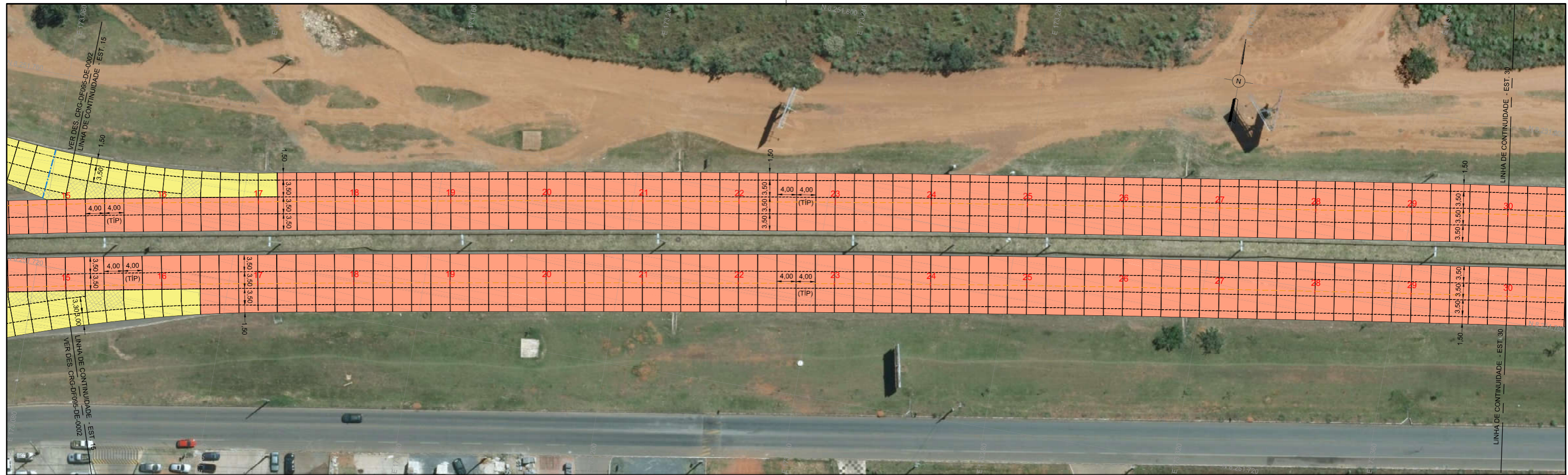
PLANTA 0 4 8 16 32m ESCALA 1:400