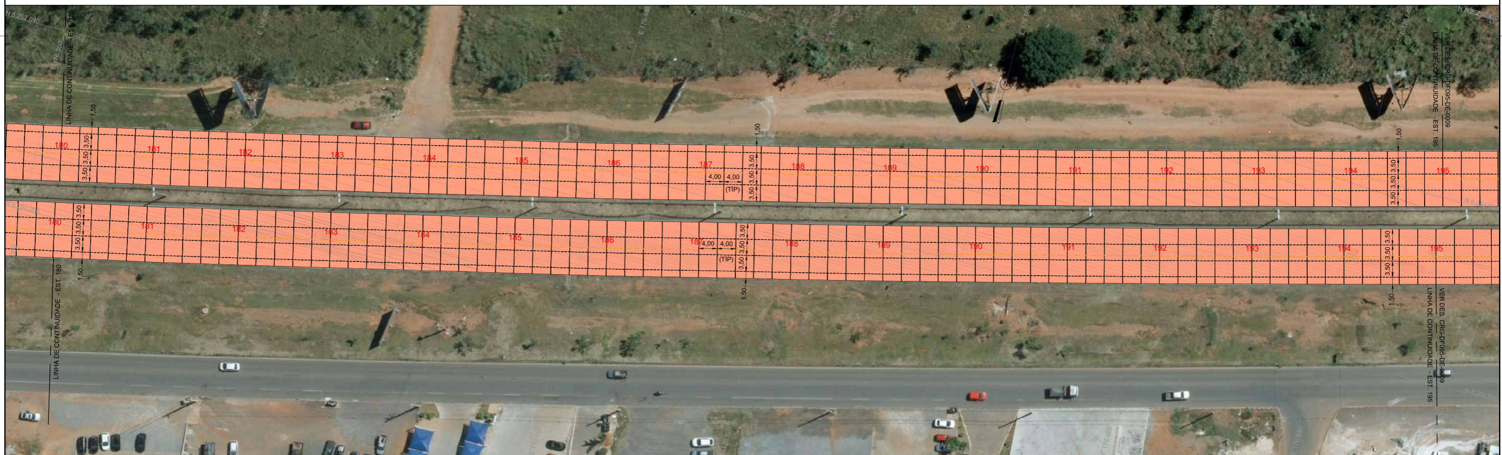
PLANTA 0 4 8 16 32m ESCALA 1:400

NOTAS: 1 - TODAS AS DIMENSÕES ESTÃO EM METRO, EXCETO ONDE INDICADO. 2 - PARA DETALHES DE GEOMETRIA, TERRAPLENAGEM, DRENAGEM E SINALIZAÇÃO, CONSULTAR DOCUMENTOS ESPECÍFICOS.