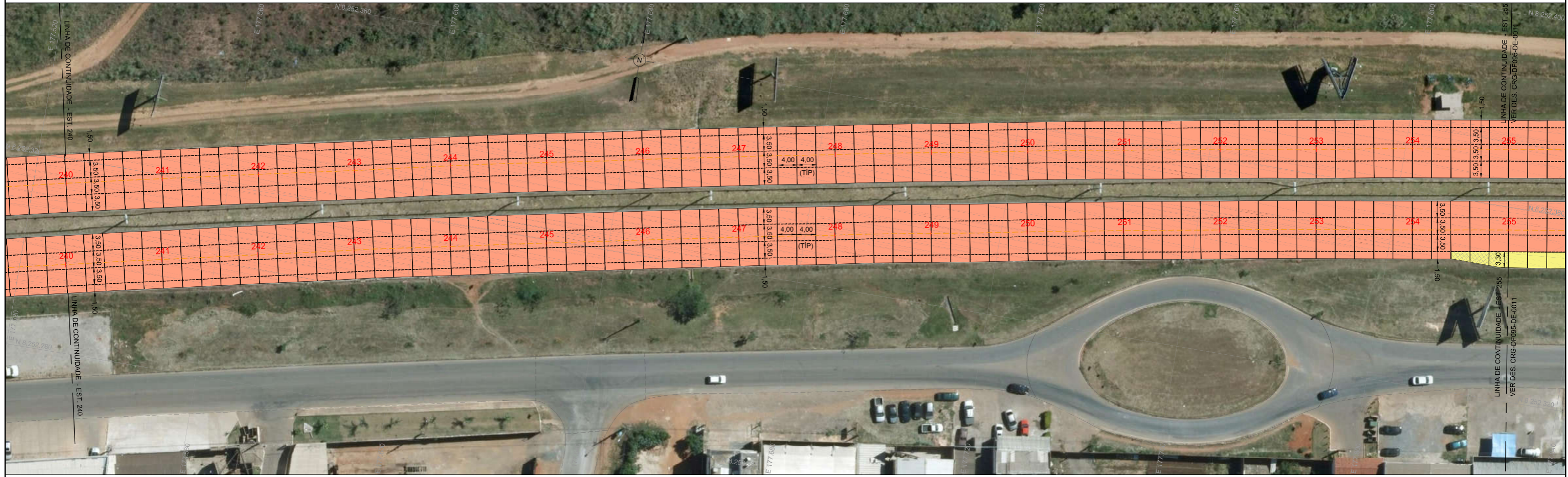
PLANTA 0 4 8 16 32m ESCALA 1:400