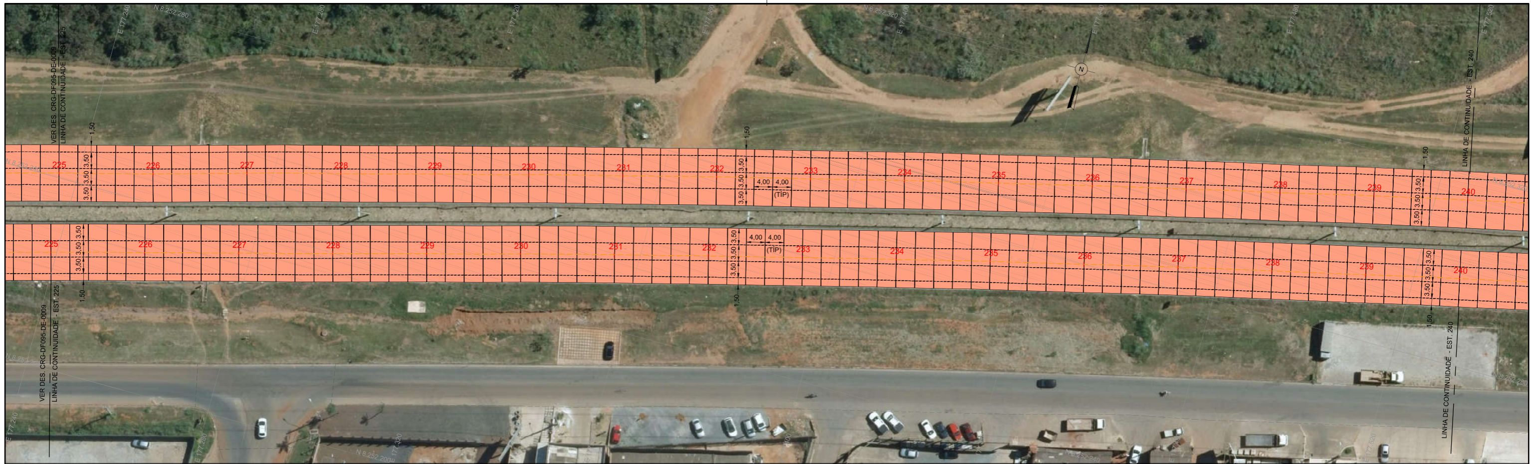
PLANTA 0 4 8 16 32m ESCALA 1:400