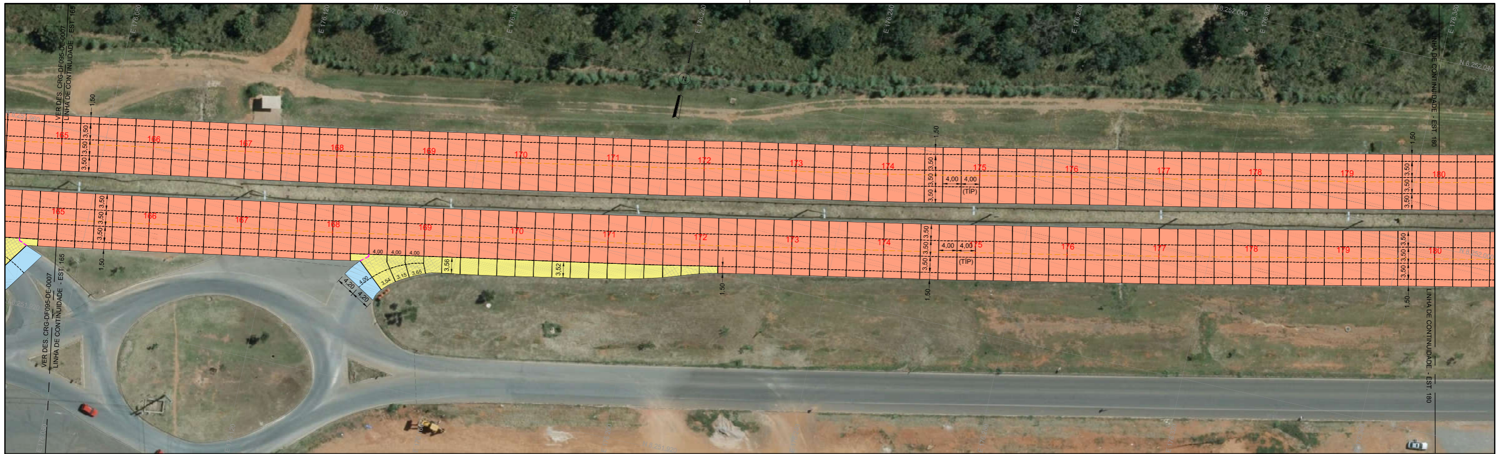
PLANTA 0 4 8 16 32m ESCALA 1:400