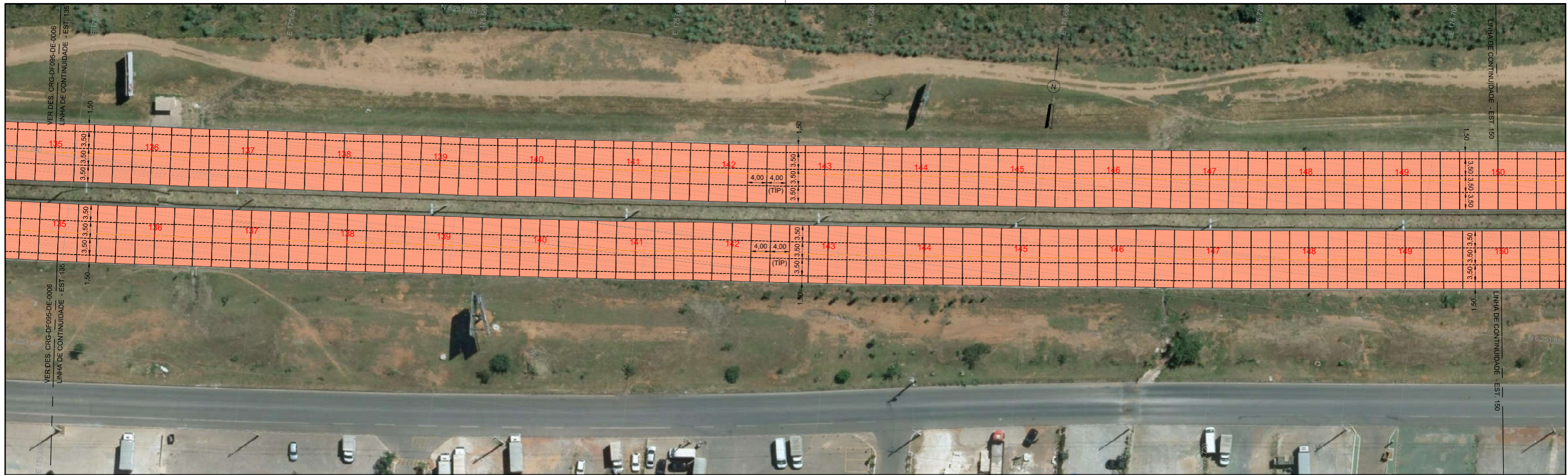
PLANTA 0 4 8 16 32m ESCALA 1:400