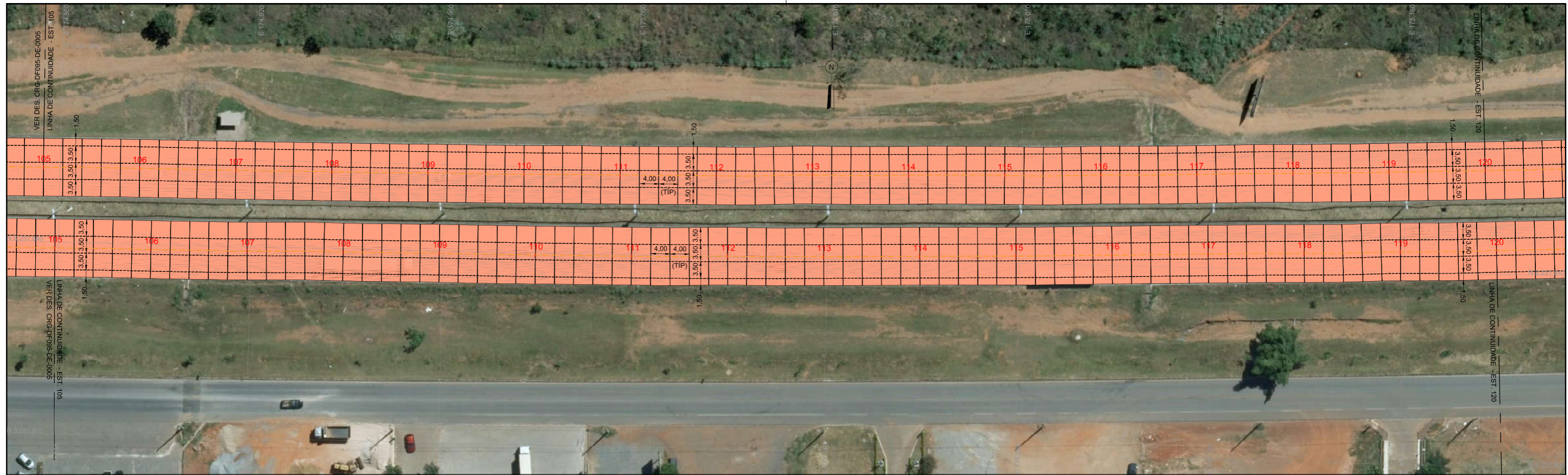
PLANTA 0 4 8 16 32m ESCALA 1:400