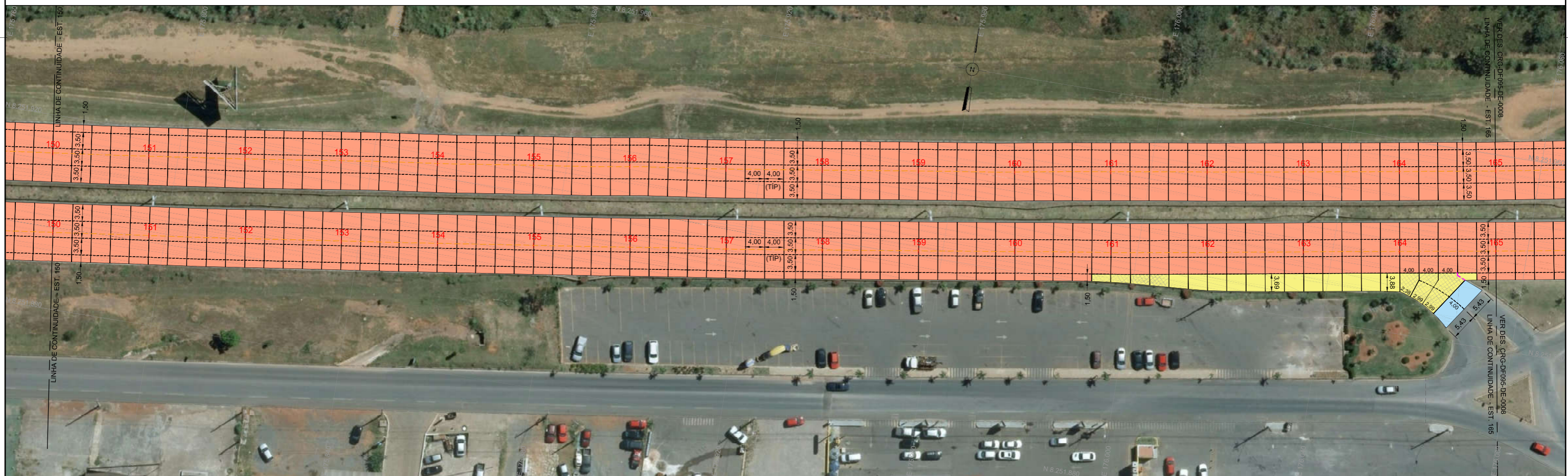
PLANTA 0 4 8 16 32m ESCALA 1:400

NOTAS: 1 - TODAS AS DIMENSÕES ESTÃO EM METRO, EXCETO ONDE INDICADO. 2 - PARA DETALHES DE GEOMETRIA, TERRAPLENAGEM, DRENAGEM E SINALIZAÇÃO, CONSULTAR DOCUMENTOS ESPECÍFICOS.