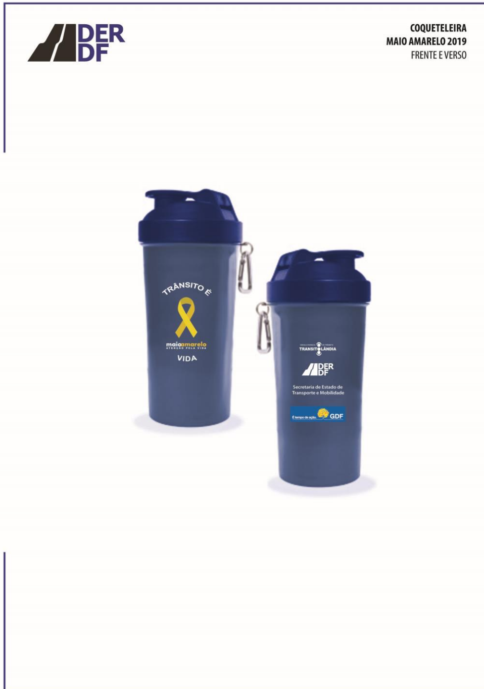
IMAGEM 3 – PIN EM METAL