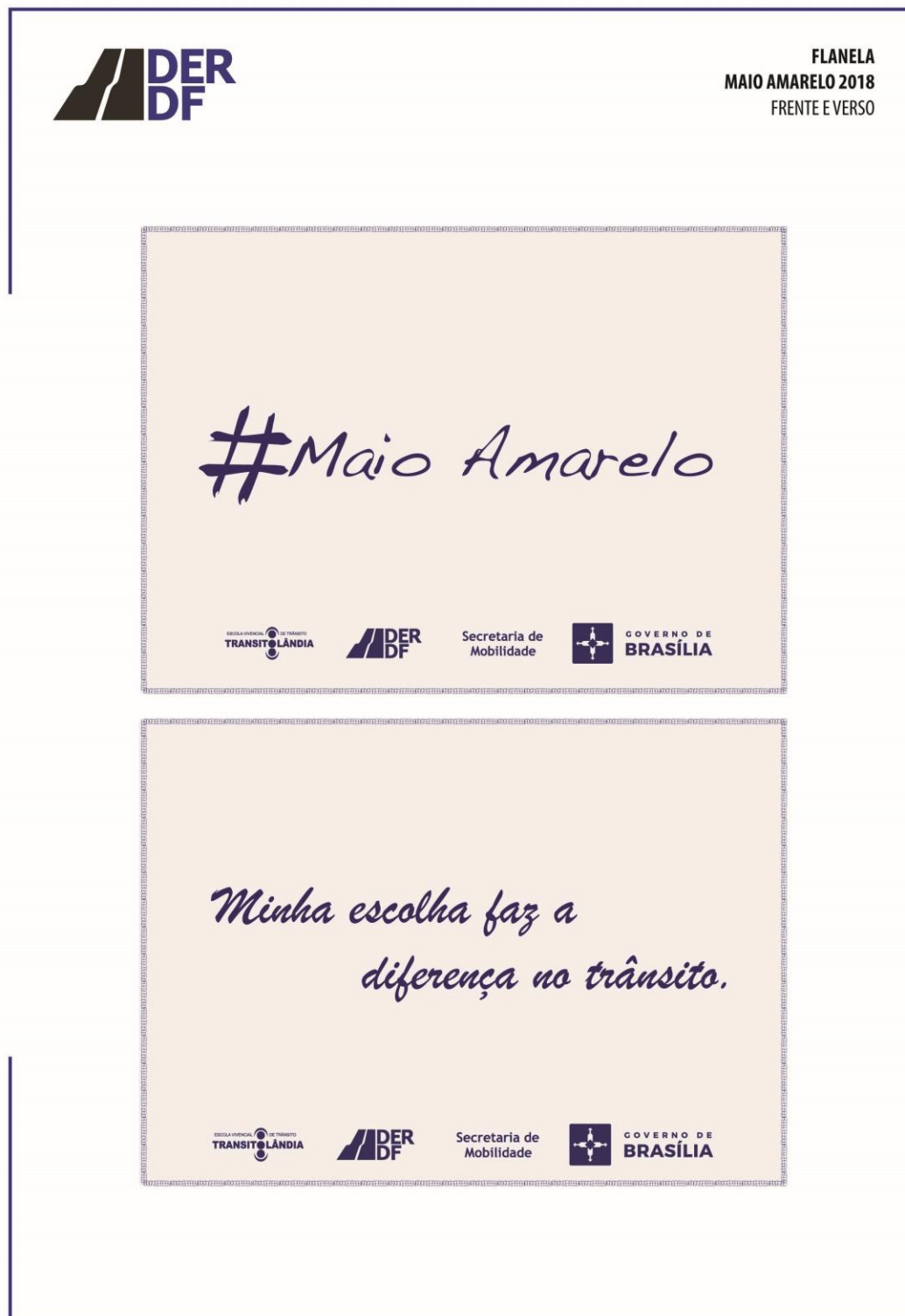
IMAGEM 7 – BONÉ