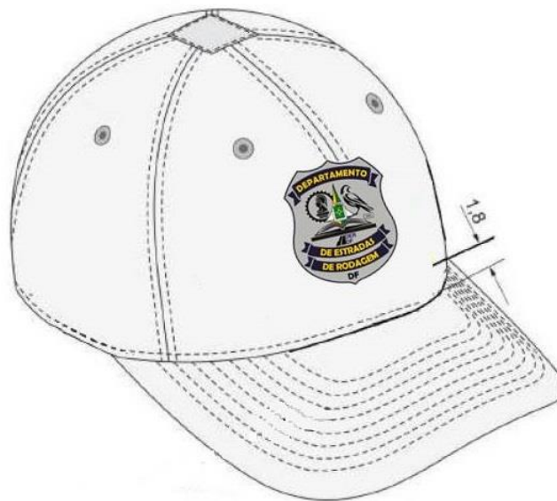
Figura 02 – Detalhes da parte frontal