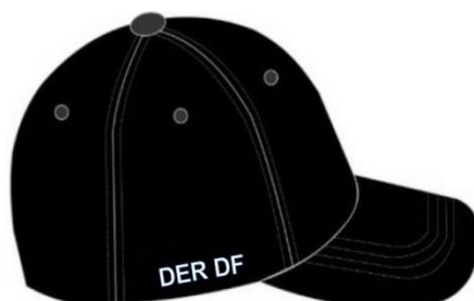
Figura 05 – Lateral Direita