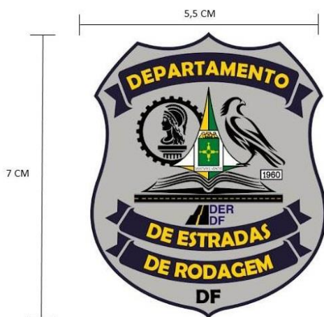
Figura 03 – Detalhe do Brasão do DER/DF

Na lateral esquerda bandeira do DF e bandeira do Brasil bordadas, e na direita, no corpo do boné, terá o nome do DER DF bordado. (inscrição "DER DF" Fonte: TypoSlab Irregular Demo).