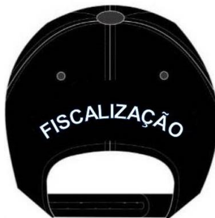
Figura 09 – Bordado parte traseira

Boné apresenta inscrição " FISCALIZAÇÃO " bordada na cor branca em forma de semicírculo diretamente na seção TRASEIRA do boné, em alta definição, centralizado e com bordado de acabamento (Figura 09 e 10).