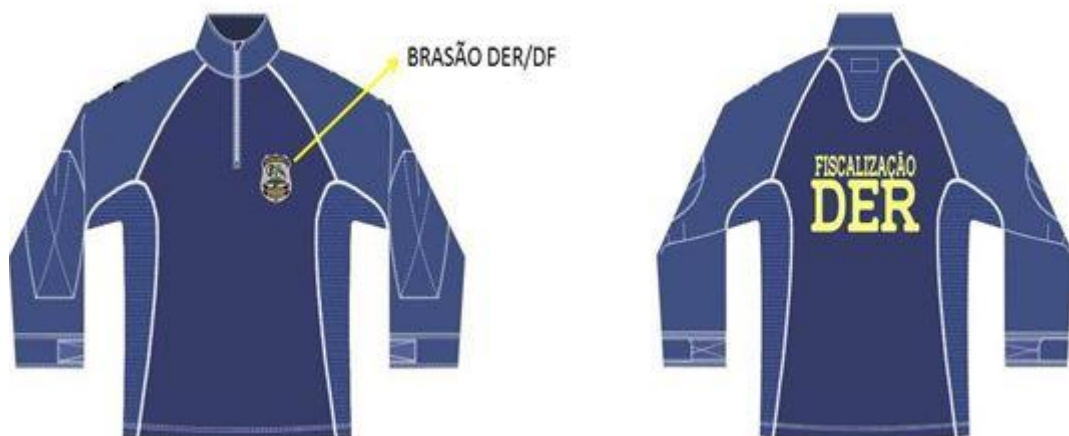
Figura 1 – Vistas frontal e traseira da camisa