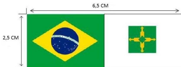
Figura 06 – Detalhe da Lateral - Bandeiras do Brasil e do DF.