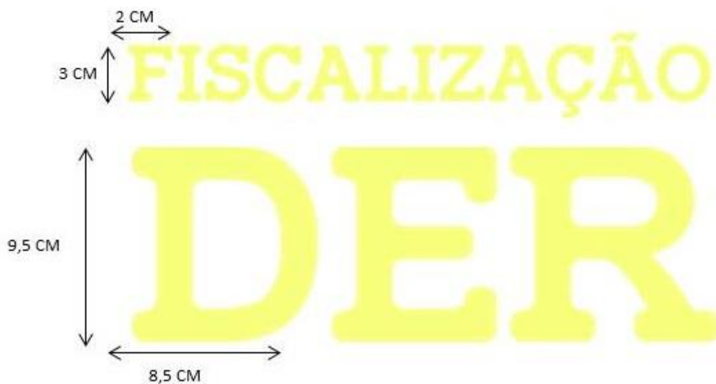
Figura 1.2 Logotipo DER : Estampado em filme de recorte no centro das costas. Na sigla DER cada Letra deverá ter altura de 9,5cm e largura 8,5cm na cor amarela, e acima os dizeres "FISCALIZAÇÃO" com letra tamanho 3cm de altura e 2cm de largura. (Cor do Logotipo DER/FISCALIZAÇÃO; Cor: Amarela; Pantone: 123C; CMYK: C=2, M=20, Y=100, K=0; RGB: R=252, G=201, B=23; HSB: H=47, S=91, B=99; HEX: #fcc917.