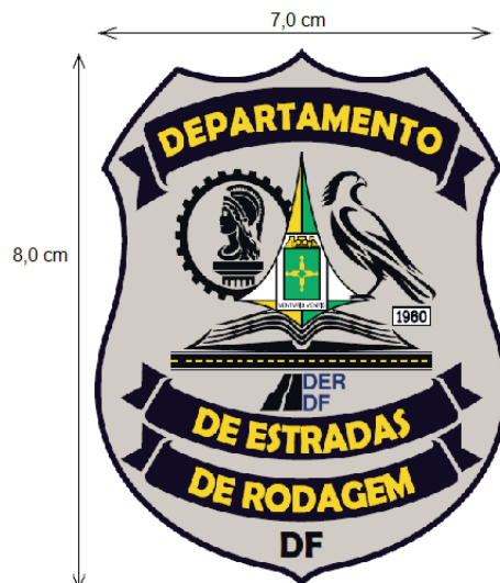
Figura 1.1 Brasão DEPARTAMENTO DE ESTRADAS DE RODAGEM : Estampado em filme de recorte no lado esquerdo frontal do usuário 8 cm de altura x 7 cm de largura.