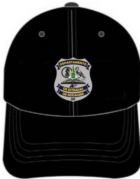
Figura 01 – Vista Frontal