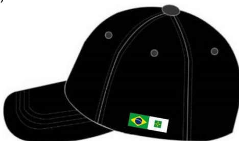
Figura 04 – Lateral esquerda

Na lateral esquerda bandeira do DF e bandeira do Brasil bordadas, e na direita, no corpo do boné, terá o nome do DER DF bordado. (inscrição "DER DF" Fonte: TypoSlab Irregular Demo).