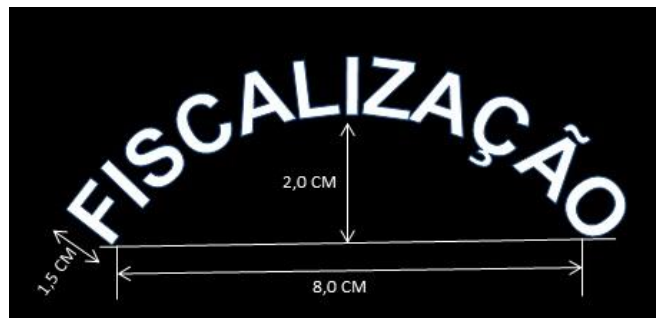
Figura 10 – Detalhe do bordado na parte traseira