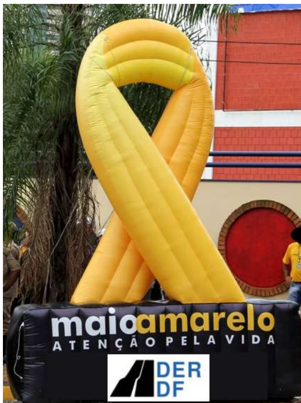
Fig. 03 - Imagem meramente ilustrativa - Balão Gigante para propaganda - Logotipo/Logomarca do MAIO AMARELO - mínimo: altura 3 m do laço inflável, base na cor preta com altura de 1 m e largura 1 m.