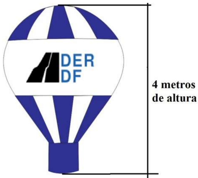
Fig. 01 - Modelo do balão Roof Top a ser fornecido, se assemelha muito ao modelo de um balão de ar quente, ou ao design de uma lâmpada;