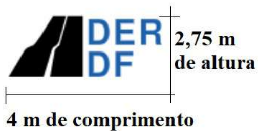
Fig. 02 - Balão Gigante para propaganda - Logotipo/Logomarca do DER/DF - mínimo: altura 2,75 x comp. 4 x largura 0,7 - medidas em metro.