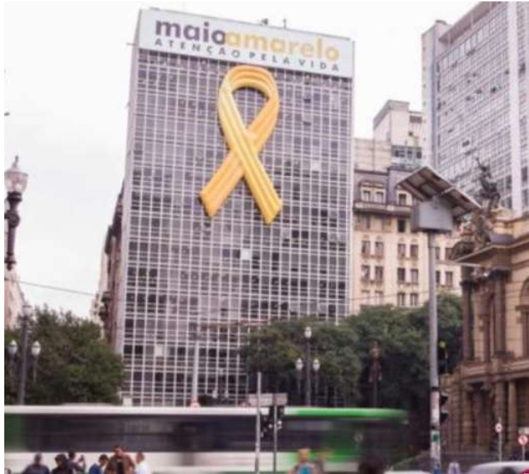
Fig. 05 - Imagem ilustrativa como representação do laço a ser utilizado na fachada do DER/DF; Fonte: https://futuretransport.com.br/maio-amarelo-pela-seguranca-no-transito-de-sao-paulo/