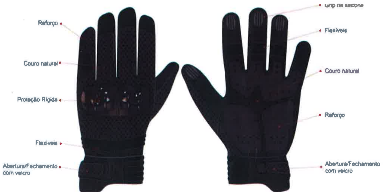
Figura 2: Esquemático Frente e Costas