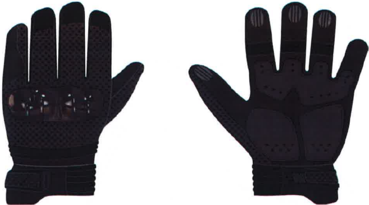
Figura 1: Frente e Costas