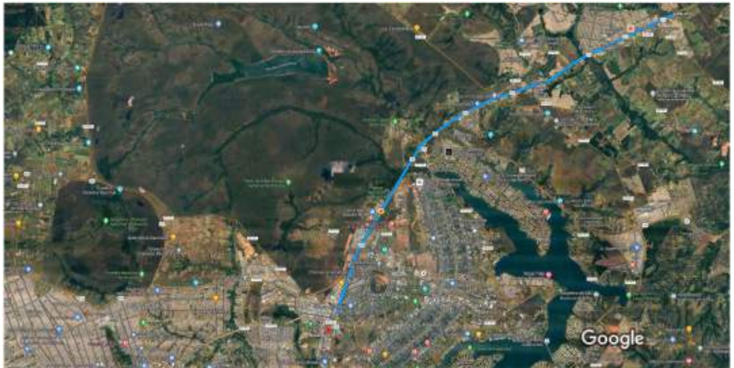
Imagens 2023 TerraMetrics, Dados do mapa 2023 Google 2 km