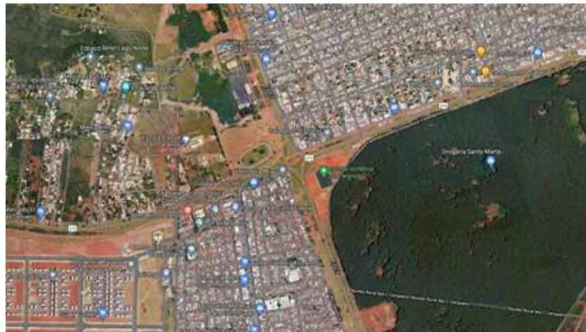
Figura 1 – Balão do Itapoã (vista satélite)

O Departamento de Estradas de Rodagem do Distrito Federal – DER-DF, apresenta o Termo de Referência para contratação através do Regime Diferenciado de Contratações Integrada (RDCi) de empresa ou consórcio especializado na elaboração dos projetos básicos e executivos e demais operações necessárias e suficiente para as obras de adequação de capacidade em especial das Obras e Serviços de terraplenagem, drenagem, revitalização do pavimento existente, de adequação da geometria das rodovias, de adequação da sinalização horizontal e vertical, da construção de OAE, da criação de ciclofaixas e ciclovias, da construção de Barreira de Concreto do F (New Jersey), da construção de Muros de Contenção, de obras complementares e proteção ambiental) na da Rodovia DF-001 (Balão de Itapoã) conforme figuras abaixo: