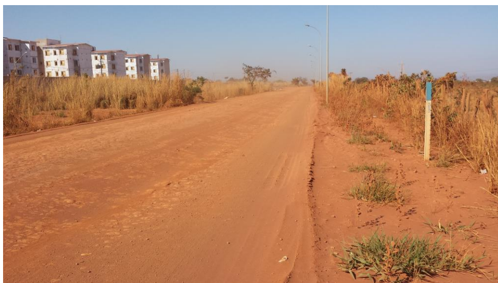
Figura 4 – Representação da área de projeto.