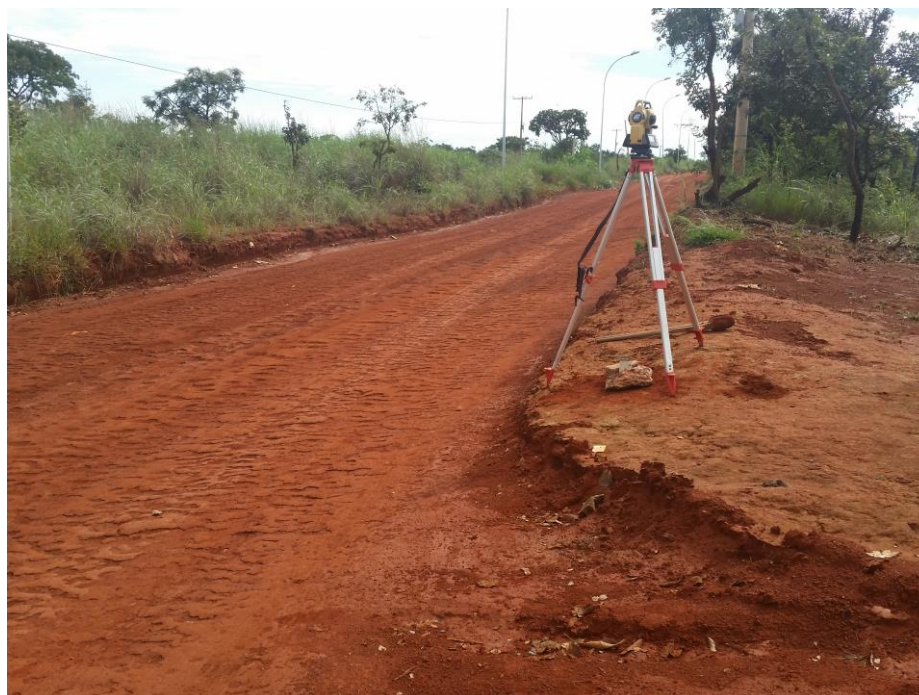
Figura 7 – Representação da área de projeto.