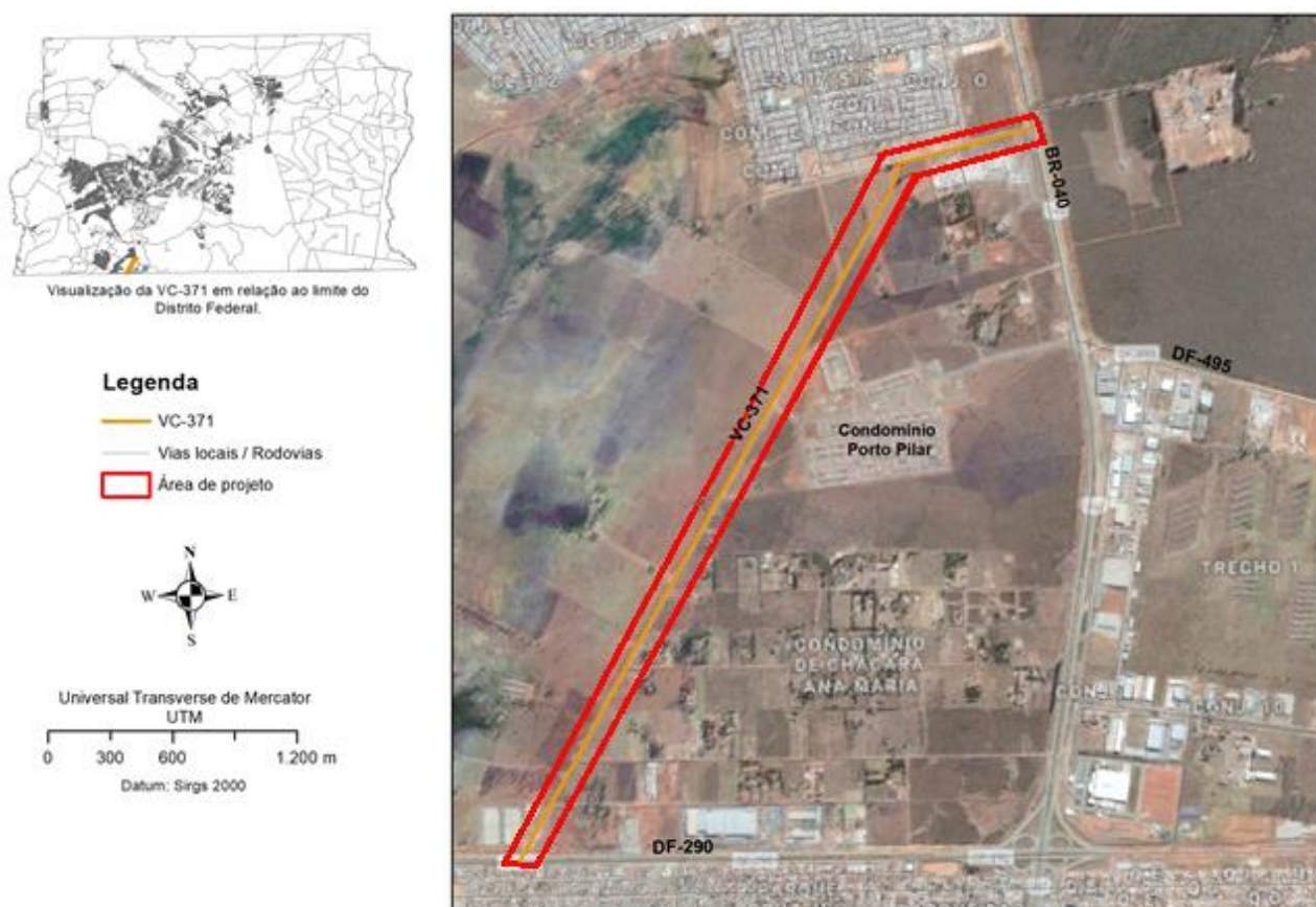
Figura 1 - Localização da Vicinal – 371 em Santa Maria no DF.

A área objeto de projeto está localizada nas folhas 215 e 216 do Sistema Cartográfico do Distrito Federal (SICAD) e toda a extensão viária compreende aproximadamente 04 Km na região administrativa de Santa Maria – RA XIII.