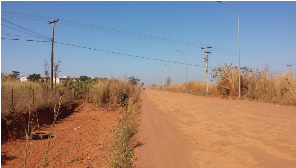
Figura 6 – Representação da área de projeto.