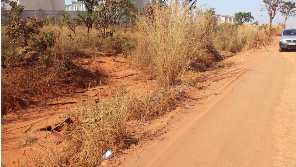
Figura 5 – Representação da área de projeto.