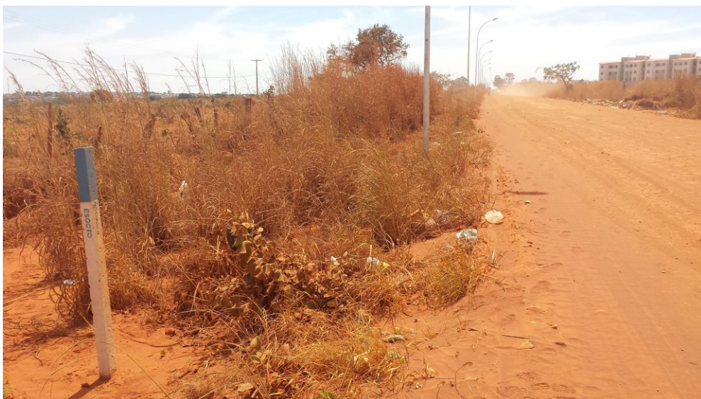
Figura 3 – Representação da área de projeto.