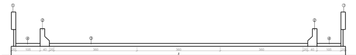
Figura 1–Seção Transversal do Viaduto Ayrton Senna

Transversalmente a obra apresenta largura total de 14,50 metros, compreendendo três faixas de rolamento no mesmo sentido de 3,60 metros, perfazendo leito carroçável com 10,80 metros (largura útil), faixa de segurança de 0,20 metros, passeio de 1,05 metros, guarda-corpo de 0,20 metros e guarda rodas com 0,40 metros em ambos os lados. Este detalhamento faz parte do projeto básico fornecido pelo DER-DF e acoplado ao Processo SEI/GDF 00113-00004431/2020-39: