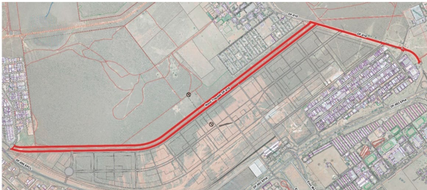
Figura 1 - Mapa de Situação - Implantação e Duplicação da DF-010

O Projeto Geométrico da Implantação e Duplicação da DF-010, trecho: no trecho compreendido a DF-003 (EPIA) - Estrada Parque Indústria e Abastecimento e com o término na DF-095 (EPCL) - Estrada Parque Ceilândia foi elaborado a partir dos levantamentos topográficos, estudos hidrológicos, geológicos e geotécnicos, realizados. Na implantação e Duplicação da DF-010 as pistas que foram divididas em eixos, conforme apresentado a seguir: