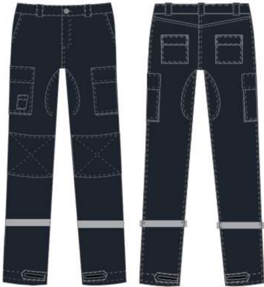
Tamanho da calça masculina