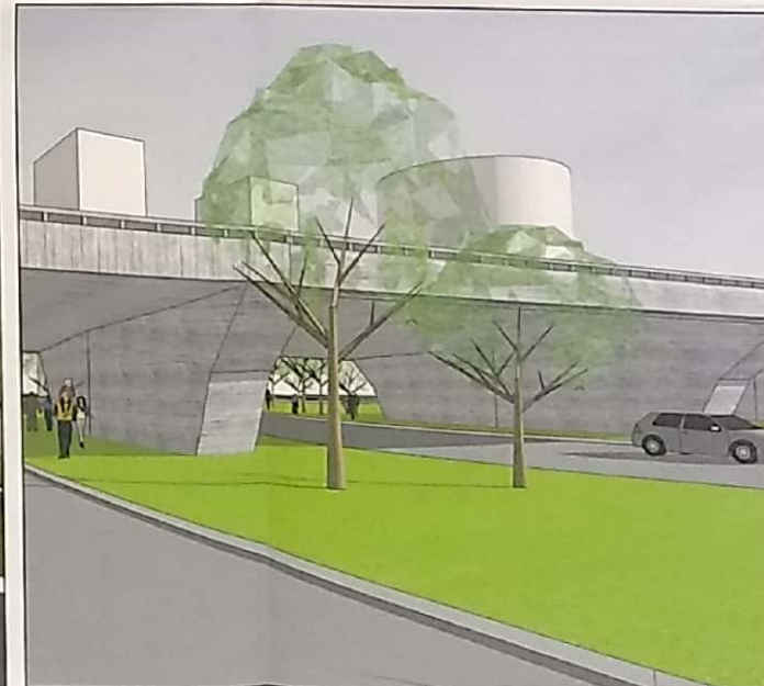
PERSPECTIVA VIADUTO ESC.: NÃO

SETOR: CENTRAL ENDEREÇO: GALERIA DOS ESTADOS ASA SUL PROPRIETÁRIO: DER/GEF AUTOR DO PROJETO: FRANCISCO AFONSO DE CASTRO JUNIOR ART./RRT: 6675967 RESP. TÉCNICO: