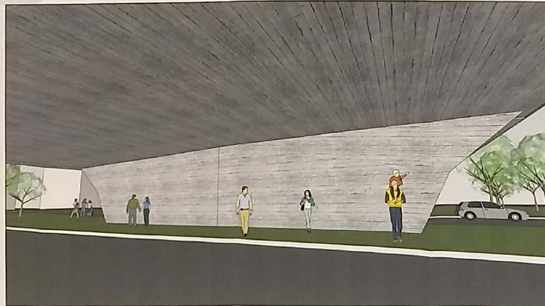
PERSPECTIVA PILAR NOVO ESC.: NÃO