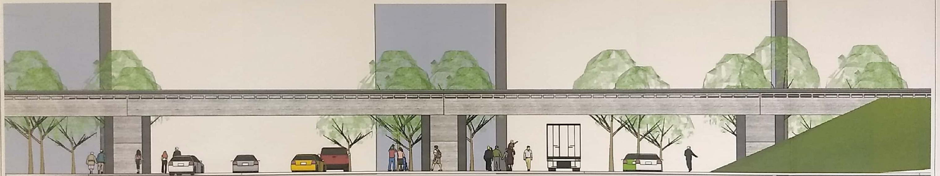
ELEVAÇÃO VIADUTO ESC.: 1/50