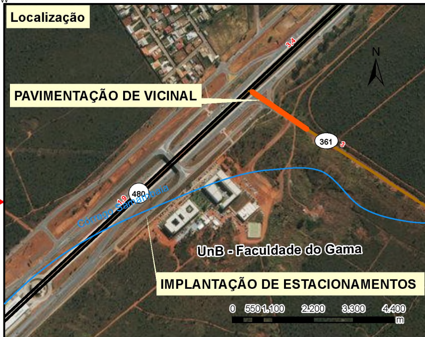
Situação do km 0 da VC-361